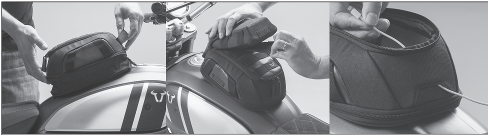
Features (von links nach rechts): Volumenerweiterung (3 l zu 5,5 l); Universelles Befestigungssystem; Kabeldurchlass. Features (from left to right): Volume expansion (3 l to 5.5 l); Universal fixation system; Cable feed-through.